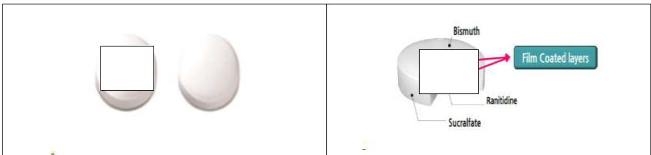
[표 4] E 구조도

이후 원고 B은 E 제조 방법에 관한 후속특허(특허번호 생략 2, 이하 'F특허' 또는 '제2특허'라 한다)를 1999. 1. 21. 출원하였고, 이를 승계한 원고 A이 2004. 10. 6. 특허를 등록하였다. F특허는 수크랄페이트와 라니티딘을 함께 복용할 경우 라니티딘의 흡수율이 저하되는 문제 1) 를 해결하기 위해, 라니티딘을 함유하는 핵정을 피막으로 감싼 후 그 위에 비스무트와 수크랄페이트를 다시 감싼 F을 제조하는 기술에 대한 특허이다. F특허는 피막이 라니티딘 중량의 5.3~10.0 중량%이고, 피막 과열시간이 20~90분인 것을 특징으로 한다.